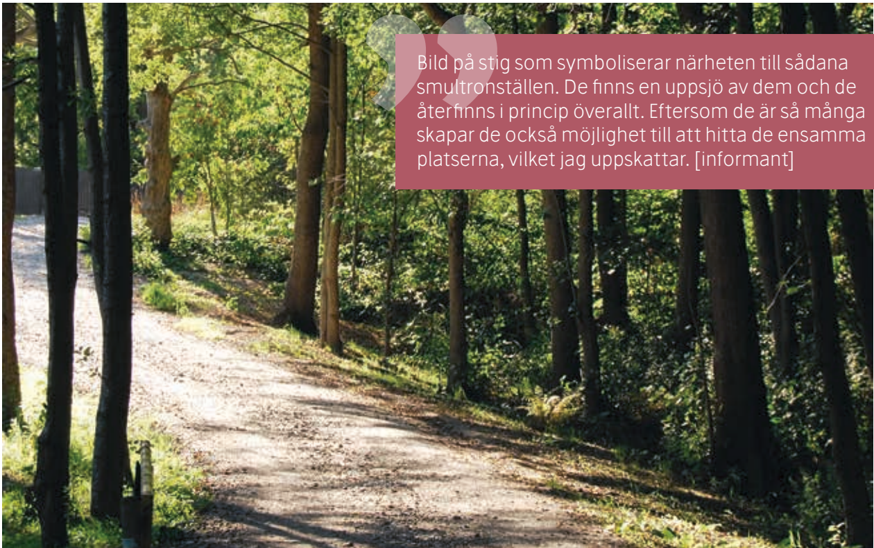
Bild på stig som symboliserar närheten till sådana smultronställen. De finns en uppsjö av dem och de återfinns i princip överallt. Eftersom de är så många skapar de också möjlighet till att hitta de ensamma platserna, vilket jag uppskattar. [informant]

vilket har gett dem nya möjligheter. Dessa möjligheter har bidragit till den förändrade synen på vad som är viktigt i livet. Exempel på insikter är att man inte behöver så många alternativ för att bli nöjd och att familjen är viktigare än vad man tidigare trott. Det exemplifieras av en av informanternas reflektion att hen har blivit mer familjeorienterad och att det inte bara beror på flytten utan kan ses som en process över tid.