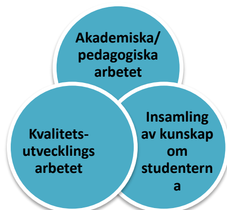
Figur 3 Använda kunskap om studenterna i det pedagogiska och kvalitativa utvecklingsarbetet (2017)